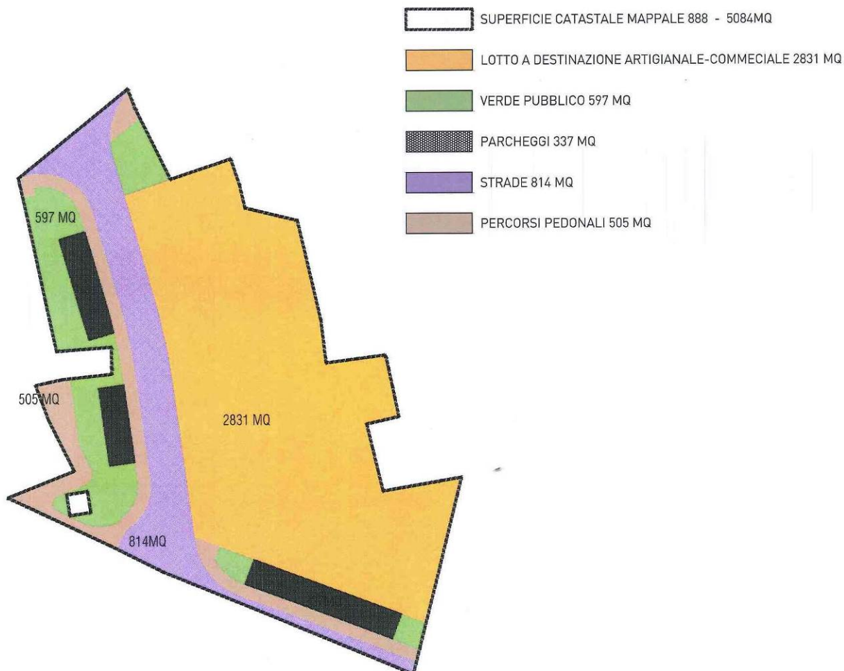
TABELLA DESTINAZIONE D’ USO DELLE AREE

Comune di Possagno prot. n. 0001679 del 11-03-2021 arrivo